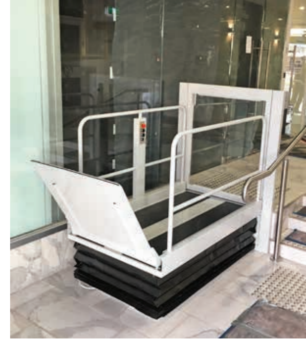
Version mit Tür an oberer Haltestelle , erhöhten Barrieren und Bediensäule